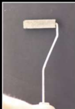
PRIMER DECOR FONDO COLORED